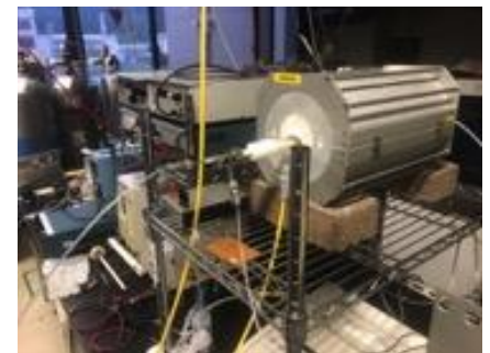
水素分離膜評価装置

現在，水素は主に化石燃料の水蒸気改質により作られています．反応後の水素は CO や CO 2 などの不純物を含んでいることから，これらを適切な方法により除去する必要があります．現在，水素分離法として圧カスイング吸着法 (PSA) が幅広く使われています．私は，安価かつ小型なインサイト型水素製造装置に利用できる水素分離型リフォーマ (HSR) の開発を行っています．HSR は水素の製造と分離を同時に行うことができるもので，多孔質セラミック触媒基板と水素透過膜の接合体で構成されています．これらの部材に用いる材料の開発や膜形態制御を行うことで，高効率かつ安価な水素製造法を開発したいと考えています．